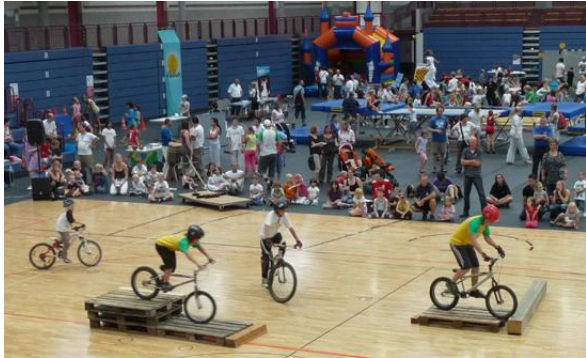
Sport macht im Verein am meisten Spaß. Dies wurde beim Sporterlebnistag eindrucksvoll demonstriert.