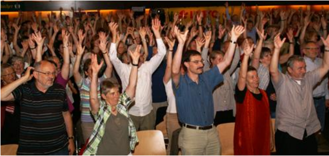
Von „unbeteiligten Zuschauern“ konnte bei den 300 Teilnehmern des Seniorensporttages keine Rede sein.

Zählen Sie zu der Kategorie „Fortsetzer“, „unbeteiligter Zuschauer“ oder „Rückzieher“? Oder werden Sie im fortgeschrittenen Alter zu einem „Abenteurer“, „Sucher“ oder gar zu einem „Genießer“? Die sechs Ruhestandspfade, die Professor Dr. Ansgar Thiel (Uni Tübingen) beim 8. Infotag „Seniorensport“ des Sportbundes Rheinland aufzeigte, ließen so manchen der fast 300 Zuhörer aufhorchen. Wo führt mein Weg hin, wenn die Kinder aus dem Hause sind, wenn nicht mehr um sechs Uhr in der Früh der Wecker klingelt und die Stechuhr auf der Arbeit schon lange aus meinem Gedächtnis verbannt ist?