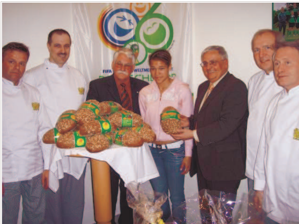
Am 31. März startete der Verkauf des "Zwanziger-Brot" im Rhein-Lahn-Kreis. Überregional ist das Brot ab Mitte April in den teilnehmenden Bäckereien erhältlich.